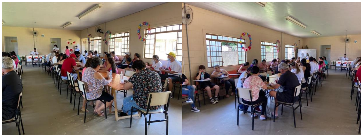
Roda de Conversa (25/10/2022):