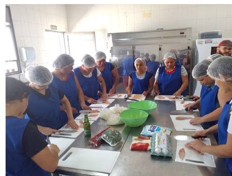
Projeto “Eu e minha casa” Caritas Paroquial Nossa Sra. Mãe dos Homens e Santo Antonio de Pádua - Louveira