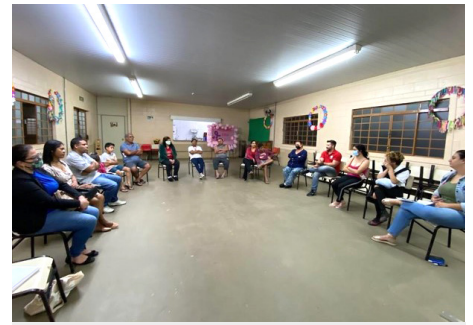
SCFV Reunião pais do grupo de crianças