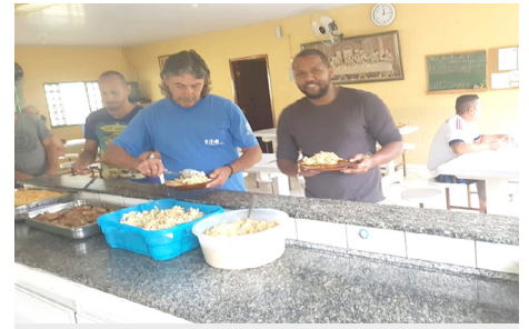
Semana Diocesana dos Pobres Casa do Senhor Jesus - Campo Limpo Pta