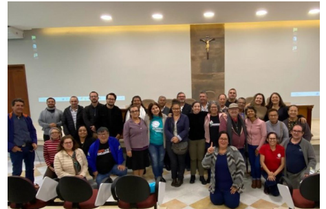
Encontro Regional de Avaliação da 6ª Semana Social Brasileira - 05.11.22