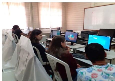
Projeto “Conhecimento Digital” - CESPROM