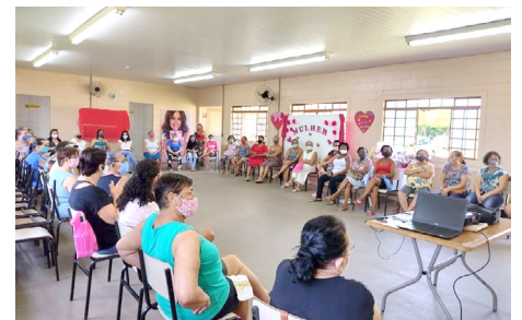
Dia internacional da mulher – 8 março