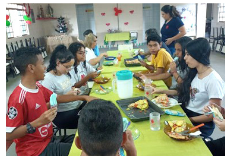
SCFV Grupo de Adolescentes Atividade de convívio: Oficina de pizza