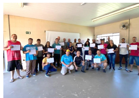
Formatura Cursos – Hidráulica Predial e Solda Elétrica