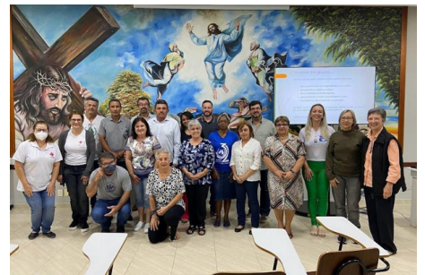
Encontro de Formação – Doutrina Social da Igreja - DSI – parceria Conselho de Leigos e Centro de Formação Fé, Política e Cidadania e Caritas. nov/22