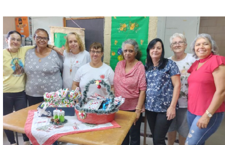
Oficinas Vida Nova Comemorações final de ano