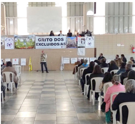
Grito dos Excluídos – Itupeva Igreja Sto Antônio