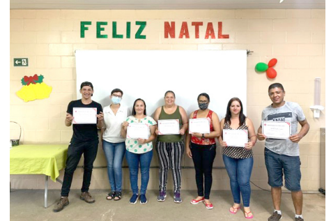
Certificado de informática adulto – dez.22