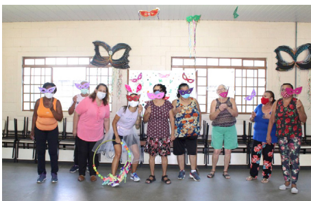
Projeto Acalanto Escutas e Vivências

• O exercício de cidadania é motivado e favorecido pela participação em espaços de controle social, como conselhos e redes territoriais