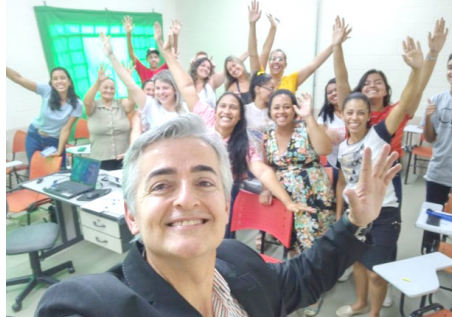
Encerramento curso parceria SENAC Assistente administrativo dez