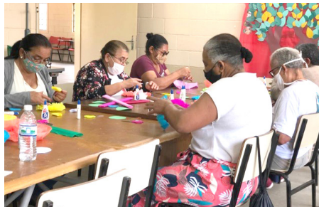
SCFV Grupo de Idosos Atividade de Convívio: artesanato