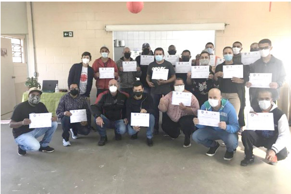
Entrega de certificado do Curso de Eletricista predial Turma do primeiro semestre