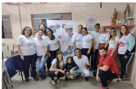
Equipe de funcionários Centro Comunitário São Francisco de Assis