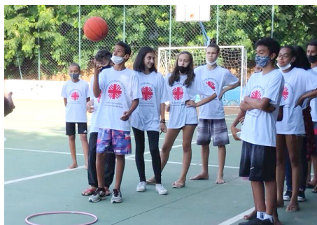
SCFV Grupo de Adolescentes Atividade de convívio: jogos colaborativos