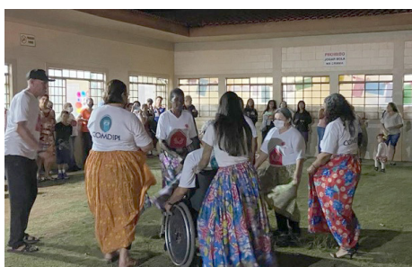
Apresentação de Dança dos Idosos Projeto Acalanto