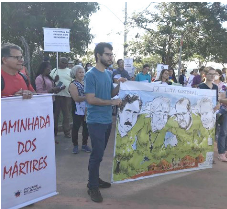
Caminhada dos Mártires – Mata Ciliar Jundiaí