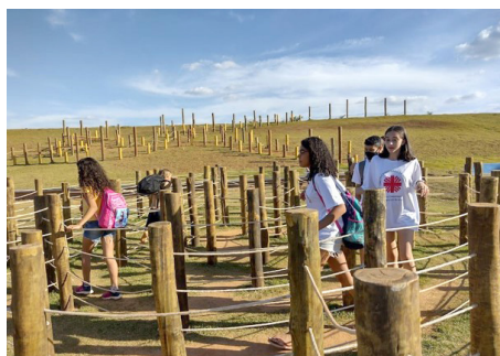
SCFV Grupos de crianças e adolescentes. Convívio Intergeracional Passeio a “Cidade das Crianças”