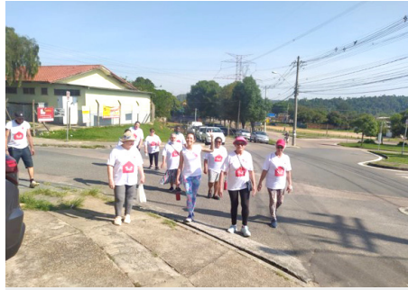
Atividade física Caminhada do Outubro Rosa