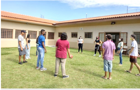
SCFV Grupo de Jovens Atividade regular: dinâmicas de grupo