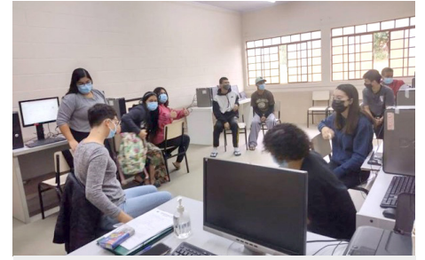
SCFV Grupo de Jovens Atividade regular - Preparação para o Mundo do Trabalho – informática