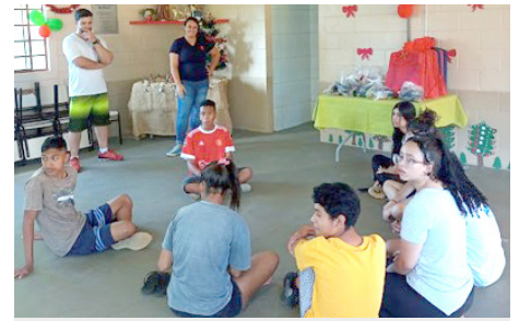
Festa de Natal – homenagem a um representante de cada serviço e projetos realizados durante 2022