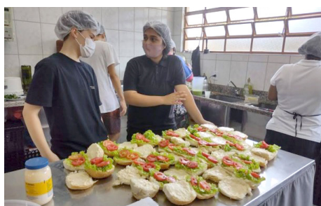
Oficina Cozinha Enriquecida Grupo de Jovens SCFV

• Foram realizadas durante o ano, com os grupos do Serviço de Convivência e Fortalecimento de Vínculos.