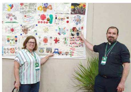
Cáritas Diocesana de Jundiaí, faz parte desta grande rede de solidariedade: Entidades membro da Cáritas Brasileira