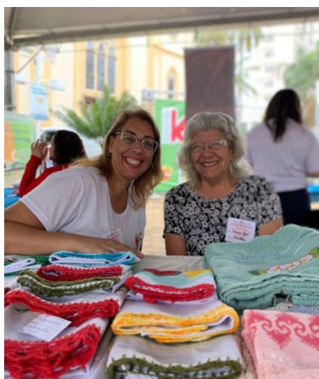
Exposição e Vendas de Artesanato Cáritas Diocesana - Projeto Vida Nova