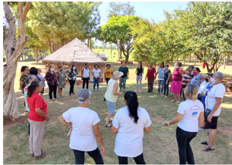
Dia dos Avós Apresentação dança circular