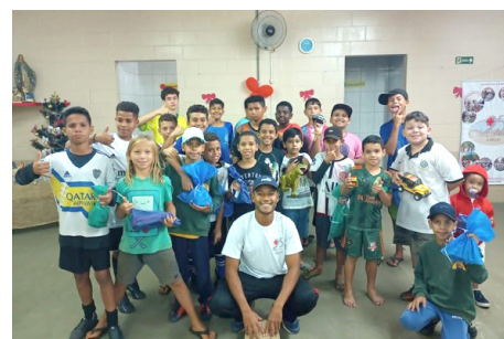
Confraternização de Natal – Futebol crianças entrega de presentes