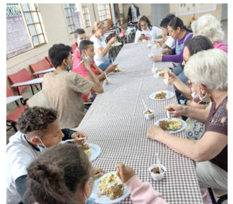
Programa Mesa Brasil SESC Jundiaí