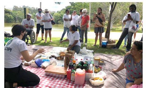
Intercâmbio cultural jovens da França e os grupos de SCFV da Cáritas