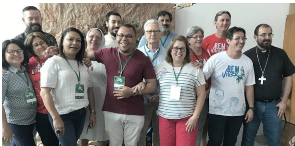
Representantes da Cáritas Regional São Paulo

A Cáritas é um organismo da CNBB e possui uma rede de mais de 200 entidades-membro, 12 regionais e 5 articulações.