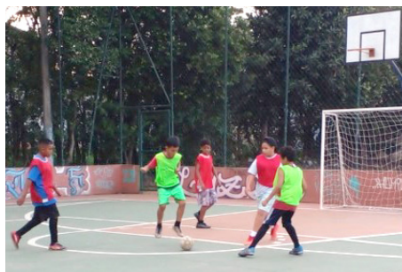
Campeonato de Futebol crianças de 7 a 12 anos