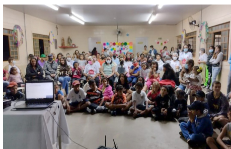
Familiares das crianças, adolescentes, jovens e idosos que são atendidos nos serviços da Cáritas