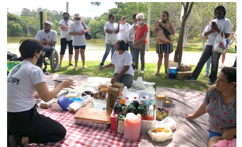
SCFV Grupo Idosos Cáritas e Associação Almater - Atividade de Convívio: Passeio no Parque Engardouro