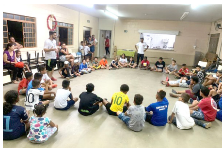
rodas de conversa Futebol Grupo Crianças