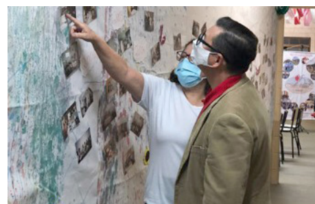
Linha do Tempo