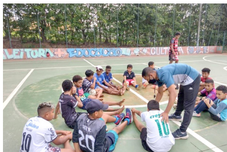
Atividade socioesportiva Futebol

• A atividade de Esporte e Recreação, futebol, ocorrem de segunda a sexta feira, no período das 17h30 às 20h30.