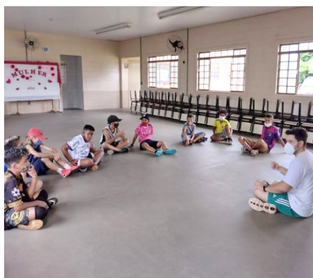
SCFV Grupo de Crianças Atividade regular – rodas de conversa

• As atividades de convívio consistem em atividades recreativas, socioesportivas, culturais e de lazer, que visam à interação social entre os participantes dos grupos etários do SCFV, a família e a comunidade; para o desenvolvimento de práticas de vida saudáveis e emancipatórias. Foram desenvolvidas através de passeios e visitas a parques e equipamentos públicos; momentos comemorativos e, as atividades de esporte coletivo e colaborativo, jogos e brincadeiras tradicionais.