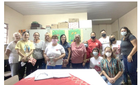
Oficinas Vida Nova Comemorações final de ano