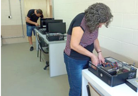
Curso manutenção computadores parceria SEBRAE - SENAC – set/22

• Atendimento a curso de Informática básica para adulto com recursos do Fundo Diocesano de Solidariedade Campanha da Fraternidade 2022 – Fraternidade e Educação