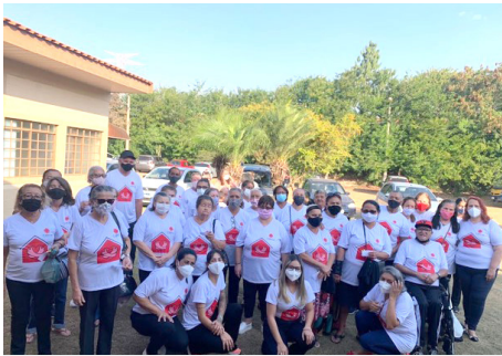
Comemoração do Dia dos avós - Integração com os idosos da Associação Almater