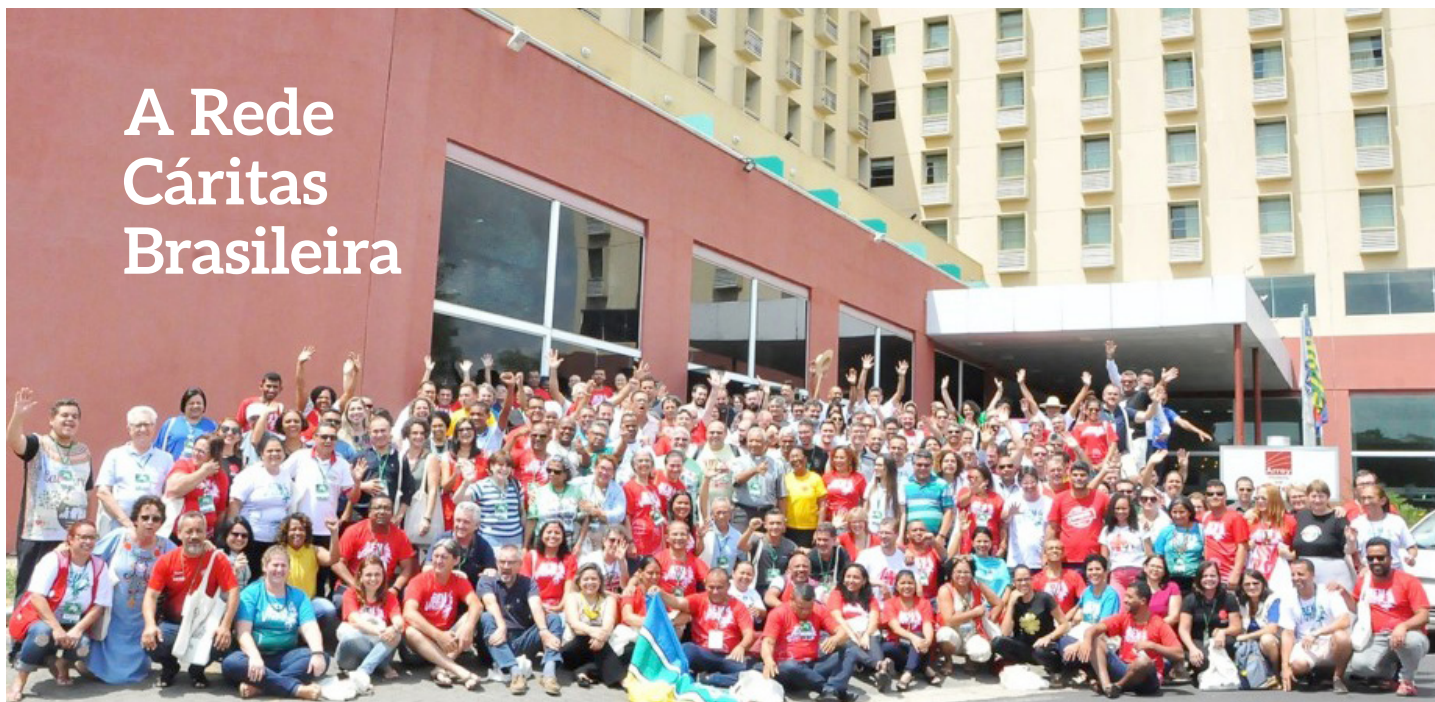
Assembleia Cáritas Brasileira: representantes das Cáritas Arqui/Diocesanas do Brasil

Fundada em 12 de novembro de 1956, é uma das 170 organizações-membro da Cáritas Internacional. Sua origem está na ação mobilizadora de Dom Hélder Câmara, então Secretário-Geral da Conferência Nacional dos Bispos do Brasil (CNBB).