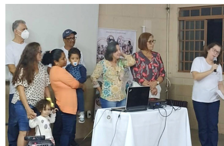
Homenagem aos primeiros voluntários, que receberam um porta retrato com fotos antigas