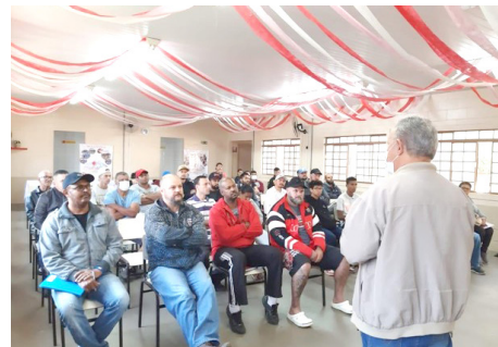
Início dos cursos solda e hidráulica segundo semestre – agos/22