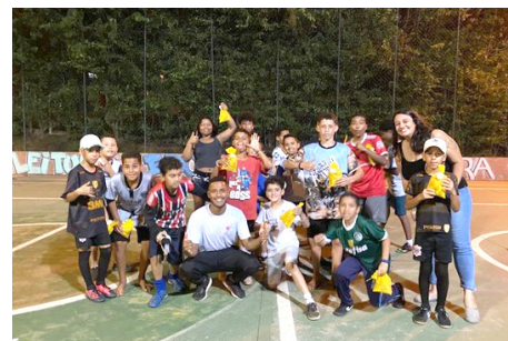
Comemorações Dia da Criança – grupo de Futebol