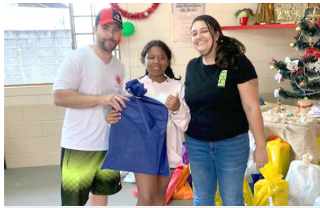
Entrega brinquedos Natal Grupo das Crianças