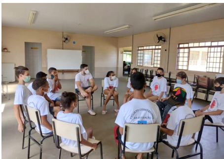
SCFV Grupo de Adolescentes Atividade regular: rodas de conversa