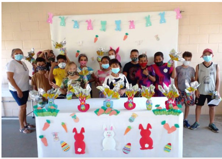
SCFV Grupo de Crianças Atividade de convívio: entrega de ovos de Páscoa.