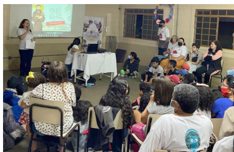
Festa no Centro Comunitário São Francisco de Assis Comemoração 25 anos out/22