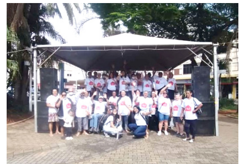
Participação Feira da Solidariedade da Caritas Diocesana – Praça da Matriz