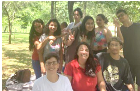
SCFV Grupo de Jovens Atividade de convívio: Picnic Parque da Cidade