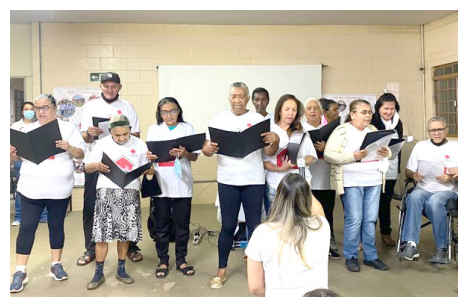
Apresentação Coral do Projeto Acalanto