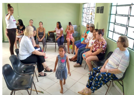
Projeto “Juntos pela Cidadania - Ações Integradas” - CEDECA