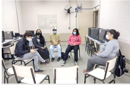
SCFV Grupo de Jovens Atividade regular: Tema Inserção no mundo do trabalho