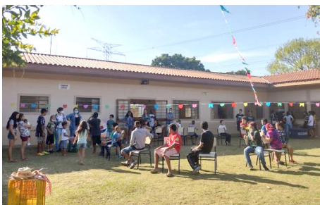
Festa Junina realizada por grupo