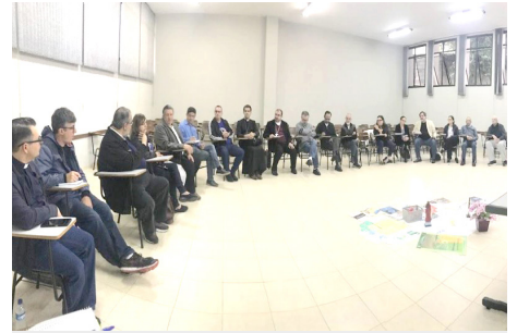
Reunião Fórum das Pastorais Sociais – set/22