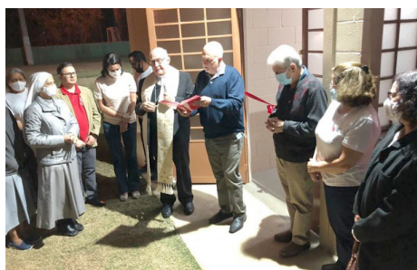
Inauguração segundo módulo – festividades dos 25 anos – 05.agosto/22

• Foi uma grande festa, com a presença da sociedade em geral, autoridades e parceiros apoiadores das ações da Cáritas, que tiveram a oportunidade de conhecer a apresentação da História da Cáritas, através de vídeos de retrospectiva histórica e um painel de fotos antigas.