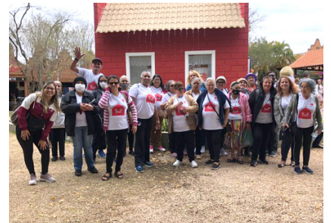
Passeio a Expoflora Holambra