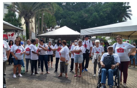
Feira da Solidariedade Nov. 22