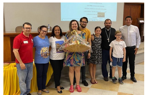
Campanha da Fraternidade encontro dez/22 - Apresentação do tema CF 2023