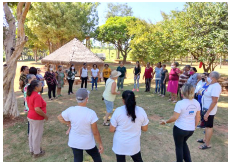
Passeios externos em parques municipais