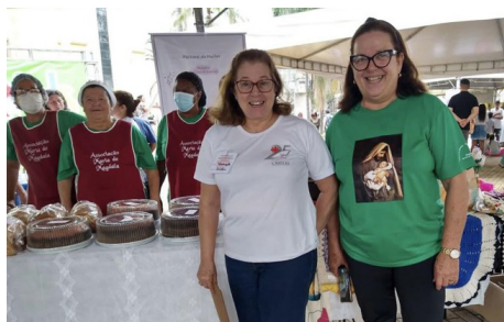
Exposição e venda de produtos Associação Maria de Magdala