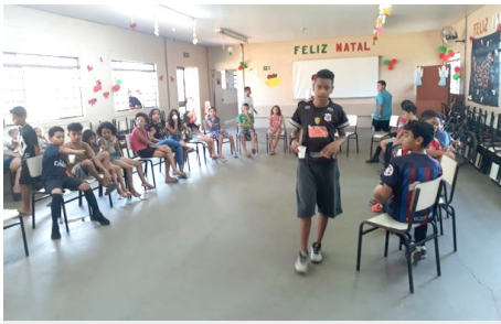
Comemorações Natal Grupo Crianças