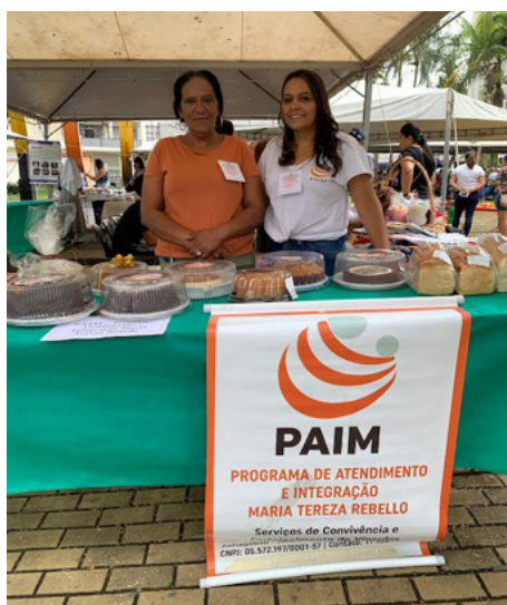
Exposição e Vendas de Artesanato - PAIM