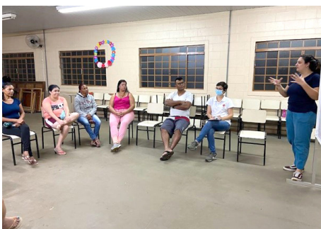
SCFV Reunião de pais do grupo de adolescentes