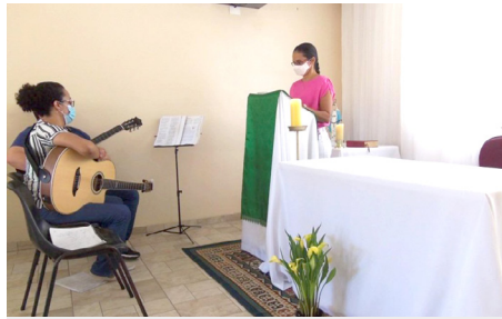
Semana Diocesana dos Pobres Casa de Belém - Salto