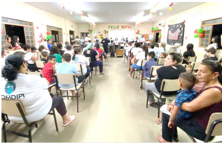
Festa de Natal – participantes e familiares - Centro Comunitário São Francisco de Assis