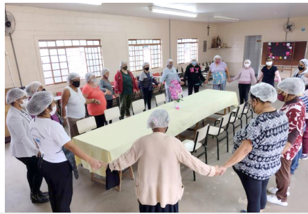
Oficina Cozinha Enriquecida