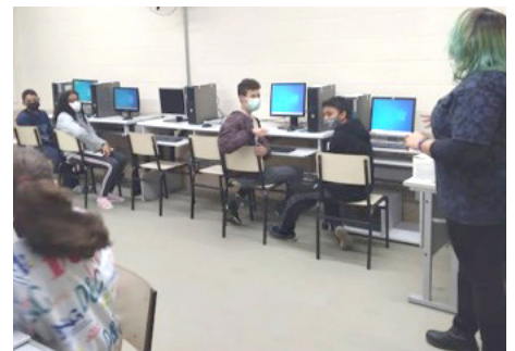
SCFV Grupo Adolescentes Atividade regular – Oficina de Informática básica