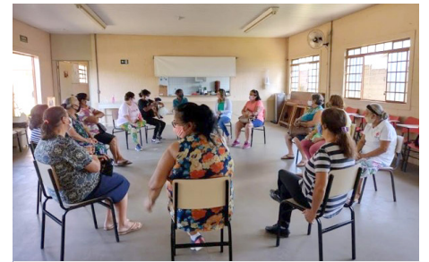
SCFV Grupo de Idosos Atividade Regular: roda de conversa