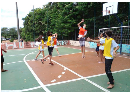
SCFV Grupo de Adolescentes Atividade de convívio: jogos coletivos