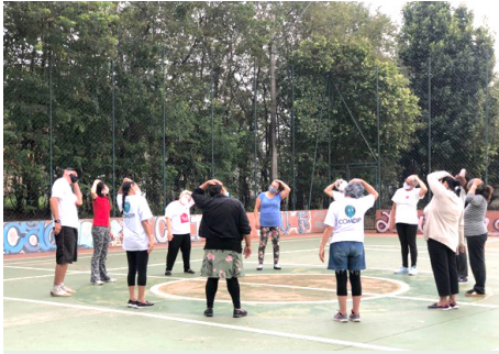
Atividade física semanal