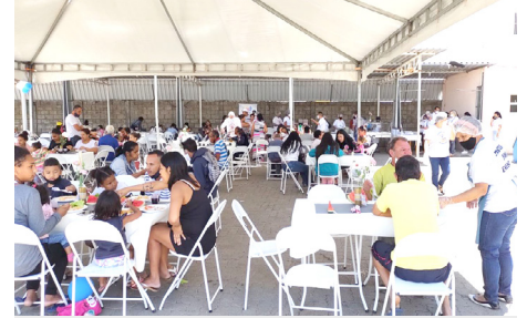
Semana Diocesana dos Pobres Par. N. Sra Aparecida - Novo Horizonte

• Objetivo: Celebrar o Dia Mundial dos Pobres, através de eventos locais e diocesanos que favoreçam a reflexão sobre a