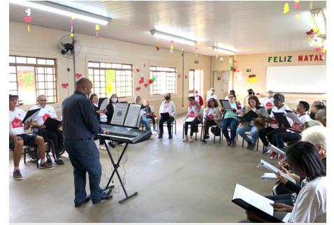
Atividades semanais de cultural – Coral