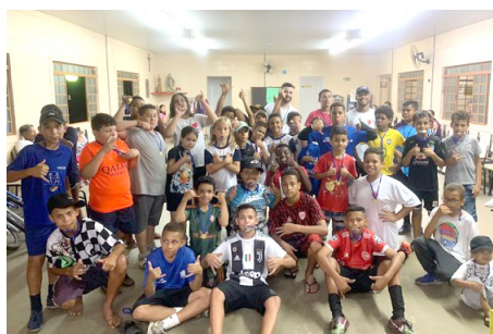
Campeonato futebol entre grupos do SCFV e Futebol