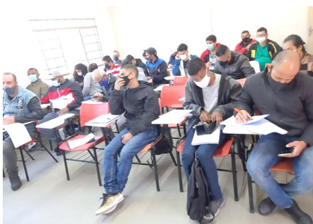
Curso de hidráulica início agosto /22