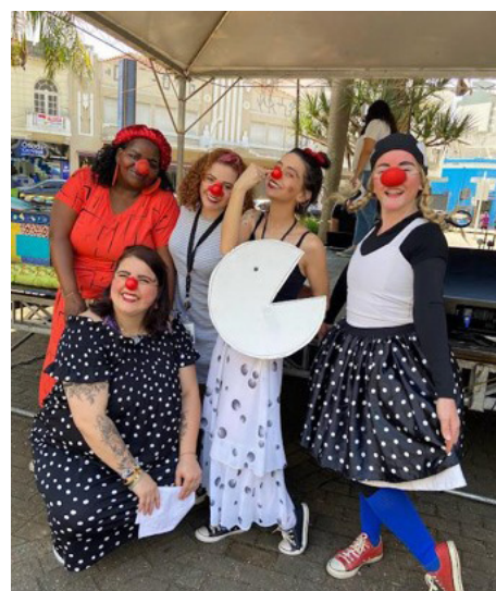
Apresentações culturais Serviço de Obras Sociais - SOS