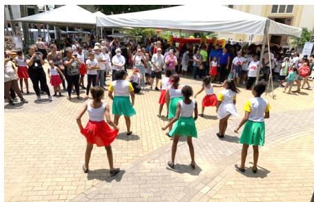
Apresentações culturais CESPROM