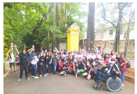
Grupos crianças, adolescentes e idosos. Convívio Intergeracional Passeio: Bosque Jequitibás Campinas