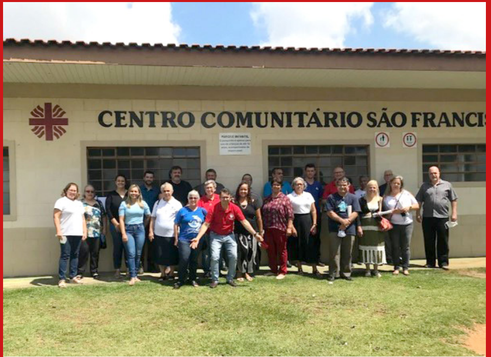
Entidades membro – Assembleia Geral março/22

Desenvolve suas atividades no atendimento às pessoas em situação de vulnerabilidade social, na defesa e garantia dos direitos socioassistenciais e na assessoria às entidades beneficentes e pastorais sociais a ela filiadas, na busca do enfrentamento das desigualdades sociais, motivando e articulando ações de solidariedade e promoção humana nas cidades que compõem a Diocese de Jundiaí