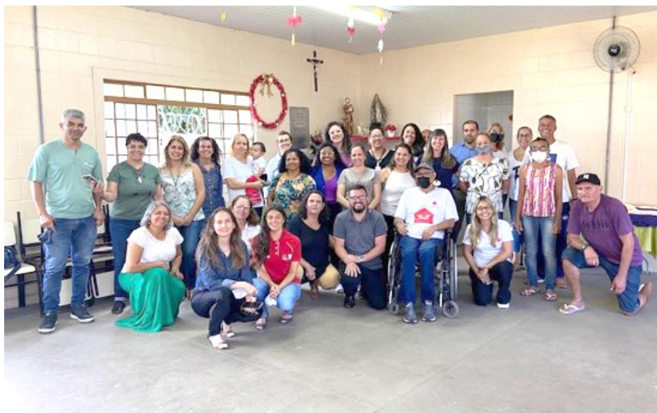
Reunião da rede socioassistencial Novo Horizonte – dez/22

Participação e articulação da rede socioassistencial do Jd. Novo Horizonte, constituída pelas as instituições do bairro ligadas à Assistência Social, Educação, Saúde, Habitação, Empresas locais com projetos de responsabilidade social, com representantes do poder público, organizações não governamentais e lideranças comunitárias.