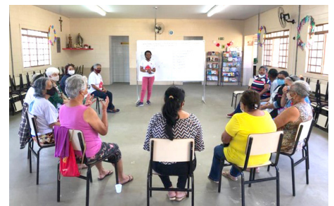
Rodas de conversa