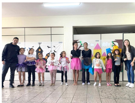
Projeto “Um novo olhar para o futuro” - Pastoral do Menor Paróquia Santa Gertrudes