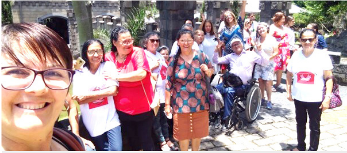
Passeio Externo Café colonial - Vinhedo