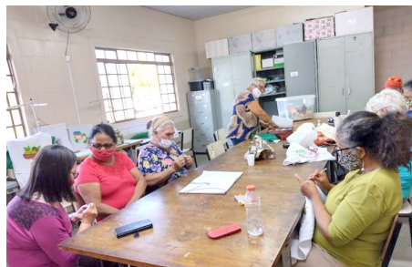
Oficina de Artesanato Vida Nova