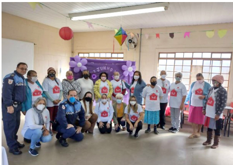
Dia Mundial da Conscientização da Violência Contra a Pessoa Idosa COMDIPI e Guarda Municipal