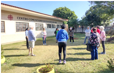
SCFV Grupo de Idosos Atividade Regular: dinâmica