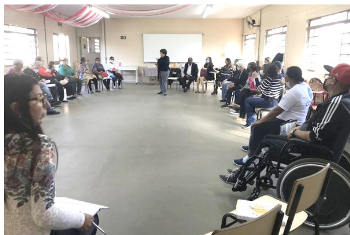
Participação Reunião do COMDIPI