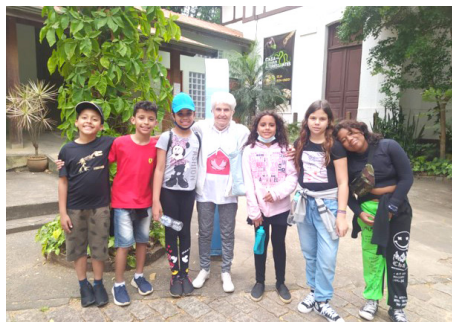
Atividade Intergeracional – Passeio com os adolescentes do SCFV Bosque dos Jequitibás Campinas