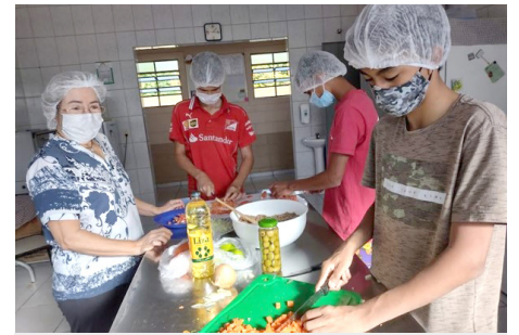
Oficina de Cozinha Enriquecida Grupo de Adolescentes SCFV