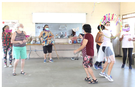
Projeto Acalanto Baile de carnaval