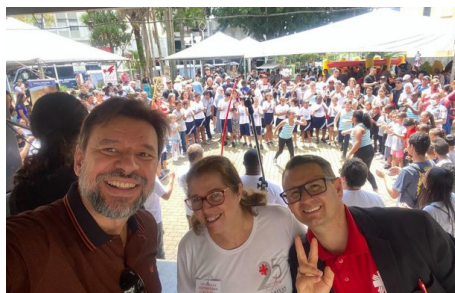
Feira da Solidariedade

• Foi realizada no dia 12 de novembro, com a participação de 16 entidades beneficentes e 7 pastorais sociais, que realizaram apresentações culturais e venda de artesanato na Praça da Catedral Nossa Senhora do Desterro.