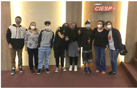
SCFV Grupo Jovens Participação Social: Fórum do Aprendizagem