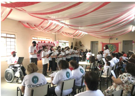
Apresentação do Coral dos Idosos