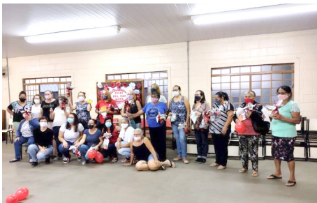
Oficinas Artesanato Vida Nova – Dia das Mães