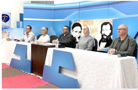
Semana Diocesana dos Pobres Live Dia Mundial dos Pobres – nov.22

• Esta atividade é um gesto concreto assumido pela Cáritas e pela Campanha da Fraternidade, partindo da dimensão da caridade e do comprometimento com a ação sociotransformadora, com programação intensa na Diocese de Jundiá, motivando ações locais nas comunidades paroquiais e ações em nível Diocesano.