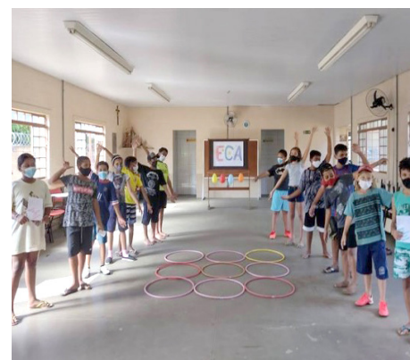
SCFV Grupo de Crianças Atividade regular – dinâmica de grupo