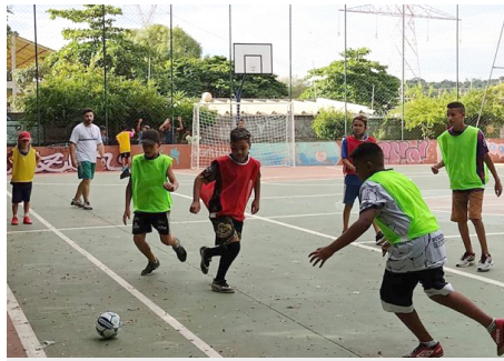
SCFV Grupo de Crianças Atividade de convívio: jogos coletivos