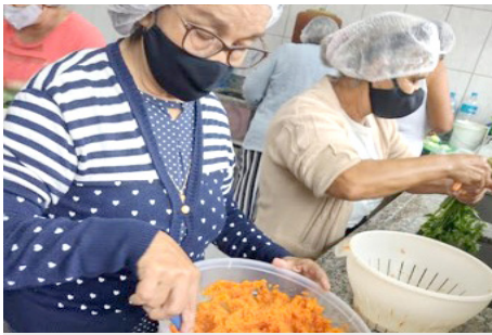
Oficina de Cozinha Enriquecida grupo dos idosos do SCFV