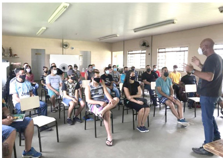
Curso de Elétrica Predial março 2022

• São realizados cursos livres de qualificação profissional na área do Serviço, para o público de jovens e adultos do território do Jd. Novo Horizonte