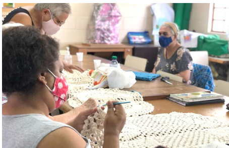
Oficina de Artesanato Vida Nova

processo de protagonismo, desenvolvimento da autonomia, sociabilidade, fortalecimento de vínculos familiares, convívio comunitário, e prevenção de situação de risco social.