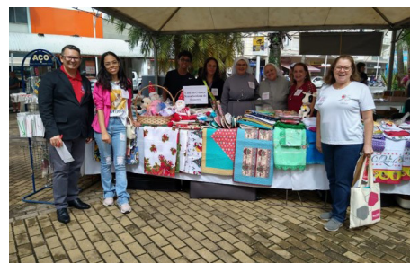
Exposição e venda de artesanatos Casa da Criança N. Sra. do Desterro