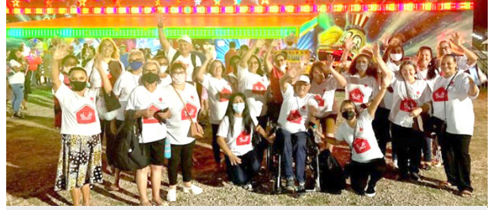
Passeio Externo - Circo Portugal