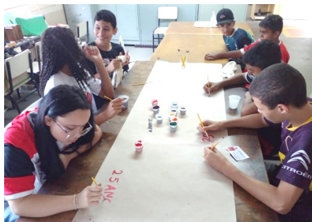
SCFV Grupo Adolescentes Atividade Regular: Atividade Lúdica