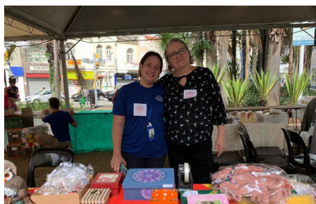
Exposição e Vendas de Artesanato Serviço de Obras Sociais - SOS