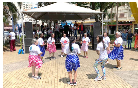
Apresentações Culturais Projeto Acalanto - Cáritas Diocesana