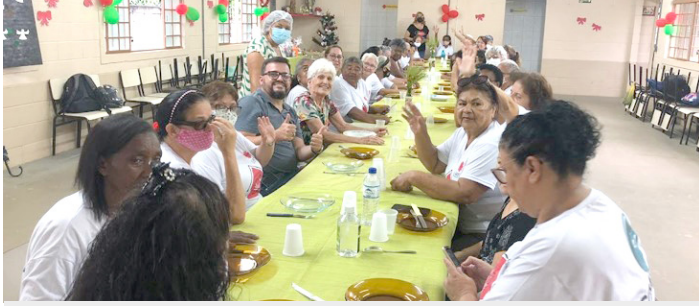
Comemoração - Almoço de Natal