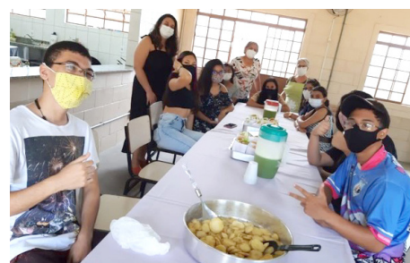
Parceria com a pastoral da Criança