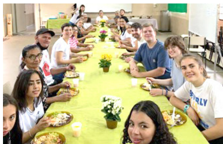
Visita Organização Família Unida da França