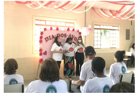
Dia dos Avós Show de Talentos Poesia, música e coral